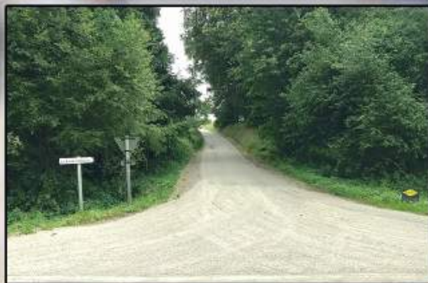
Route basse villeneuve