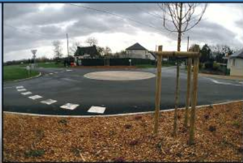
Entrée EST du bourg