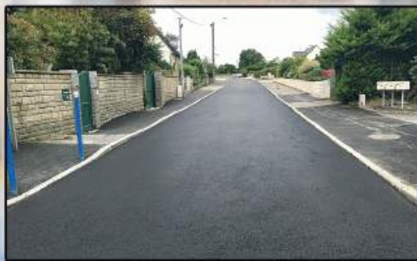
Entrée Ouest du bourg