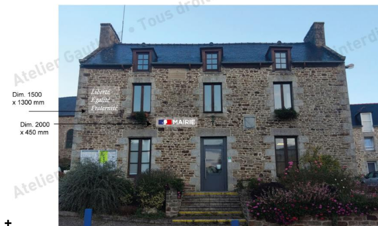
ENSEIGNE MAIRIE SAINT-CARNÉ - PROJET 3