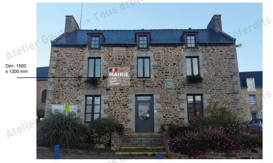
ENSEIGNE MAIRIE SAINT-CARNÉ - PROJET 2